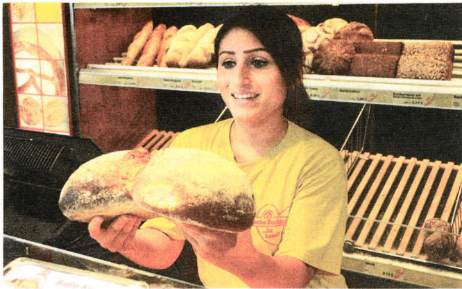
Ob in der Produktion oder im Verkauf, ein Arbeitsplatz bei der Badischen Backstüb' ist vielseitig und krisenfest.

BADISCHE BACKSTUB': Bei guten Leistungen ist Übernahme garantiert